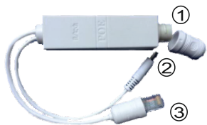
1- Вход LAN+PoE (RJ-45) 2- Выход 12 Вольт (питание видеокamеры) 3- Выход LAN (RJ-45)