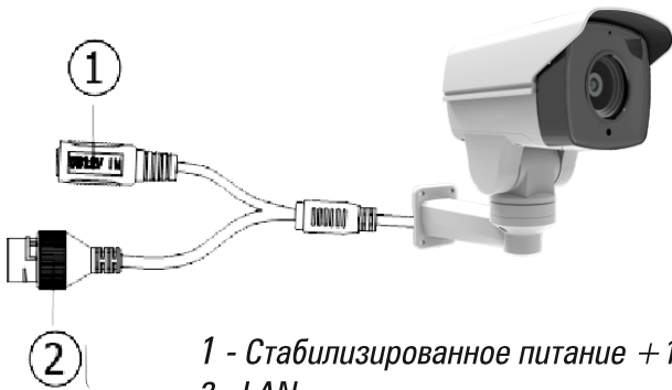
1 - Стабилизированное питание +12В 2 - LAN